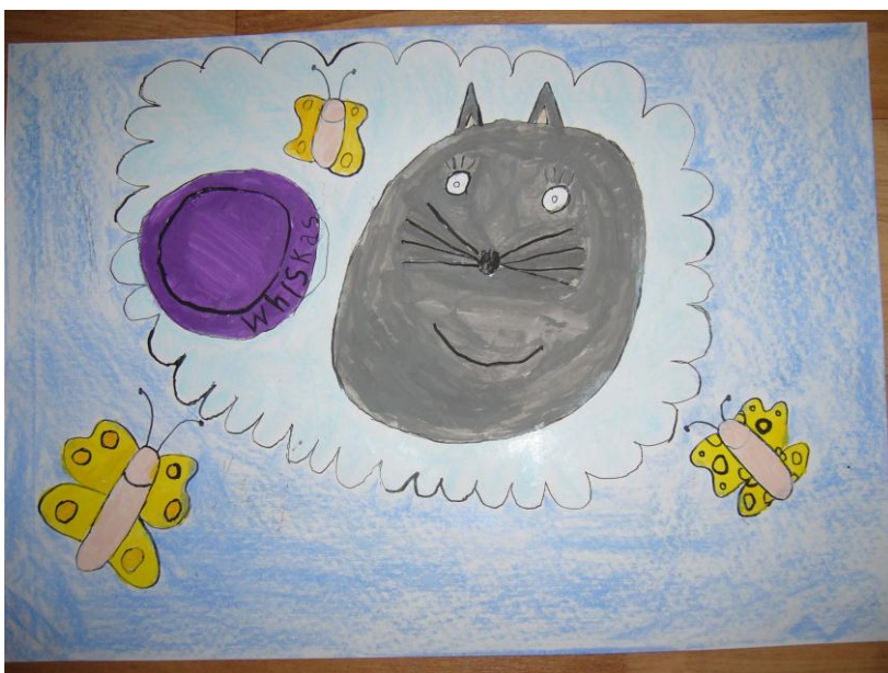
Kresby dětí ze školy k akci Pomáhejme pejskům a kočičkám v útulcích