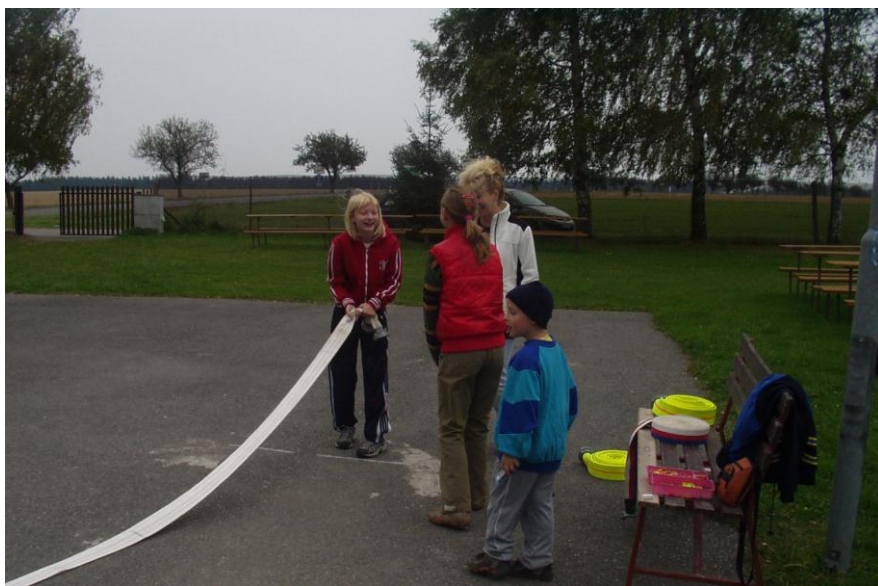
Hasičské odpoledne pro děti - 25.zář