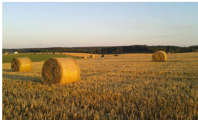
Krásný podzim nad Květnou

Letošní podzim byl opravdu nádherný, užívali jsme si slunce a tepla a teploty skoro denně překračovaly dlouhodobé rekordy a vlastně to trvá i v prosinci. Méně asi již byli spokojeni zemědělci a hlavně vodohospodáři, hladiny přehrad a řek jsou hodně nízké.