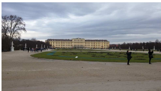
Zámek Schönbrunn, letní sídlo Habsburků

V sobotu 12. 12. časně ráno, v 6 hodin, vyjelo 39 květeňáků na zájezd do Vídně, tentokrát příjemně vytopeným autobusem. Cesta netrvala dlouho, a něco po desáté jsme vystupovali před zámek Schönbrunn. Na prohlídku jsme měli cca 3 hodiny, takže dost času si prohlédnout krásy tohoto letního sídla dynastie Habsburků. Ten byl postaven v roce 1642 na popud manželky císaře Ferdinanda II původně jako letohrádek. Ten se časem různě přistavoval až v roce 1743 ho dala do dnešní podoby přestavět Marie Terezie.