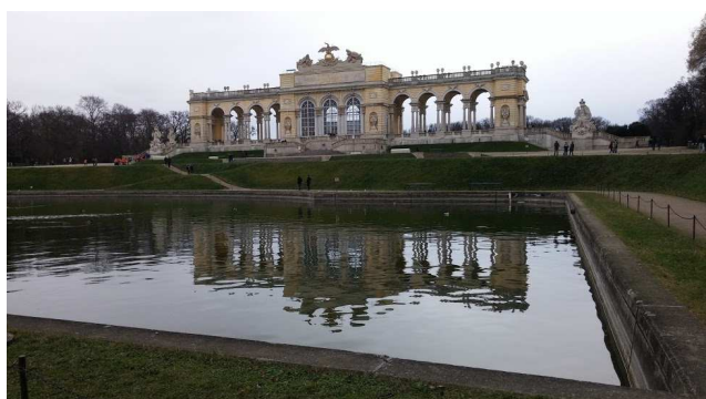
Gloriette v Schönbrunnu, zahradní restaurace.