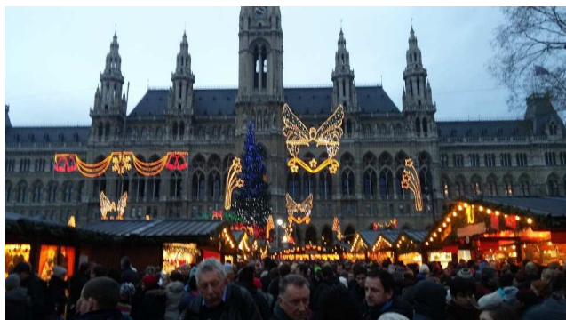
Vánoční trhy před radnicí

Ze Schönbrunnu jsme pak odjeli do centra a každý si zvolil, co chce vidět. A možností bylo samozřejmě mnoho-vídeňský hrad, dóm Svatého Štěpána, muzea a nakonec vánoční trhy před